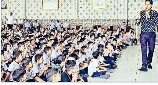
जीद। जादू का खेल देखते बच्चे।