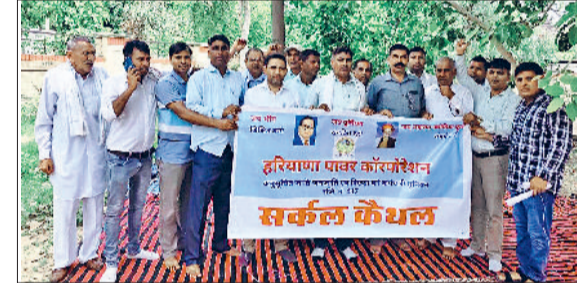
कैथल। प्रदर्शन करते एससी बीसी एमप्लाइज कर्मचारी।