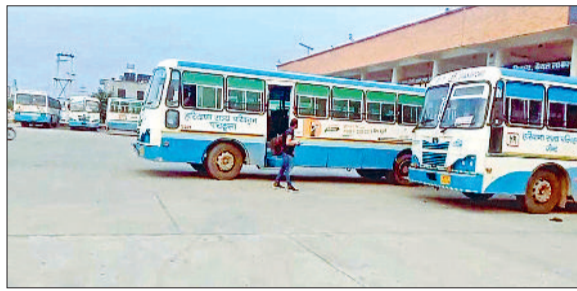
जींद। बस अड्डा पर चल रही रोडवेज बसें।

हित में काम कर रही है जबकि आम आदमी की नौकरीएं वेतन और सुविधाएं घटती जा रही हैं। साथ ही सरकार लेबर कानूनों को कमजोर करके यूनियनों को ताकत खत्म करना चाहती है। इसके अलावा सरकार की नीतियां कर्मचारियों और किसानों के भी खिलाफ हैं। रोडवेज में नई भर्तियां नहीं की जा रही। कर्मचारियों का पे ग्रेड नहीं बढ़ाया