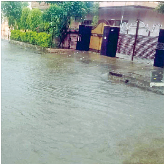
जींद। शहर की पॉश कालोनी में जमा हुआ बरसाती पानी।