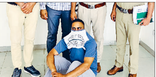
कैथल। घोखाघड़ी के मामले में पुलिस गिरफ्तार में आरोपी।