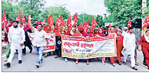
जींद। मांगों को लेकर शहर में प्रदर्शन करते संगठन।