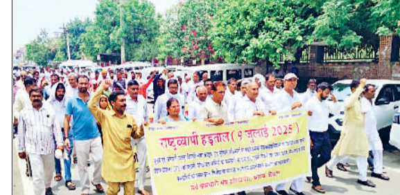
कैथल। लघु सचिवालय में प्रदर्शन करते कर्मचारी।

हित में काम कर रही है जबकि आम आदमी की नौकरीएं वेतन और सुविधाएं घटती जा रही हैं। साथ ही सरकार लेबर कानूनों को कमजोर करके यूनियनों को ताकत खत्म करना चाहती है। इसके अलावा सरकार की नीतियां कर्मचारियों और किसानों के भी खिलाफ हैं। रोडवेज में नई भर्तियां नहीं की जा रही। कर्मचारियों का पे ग्रेड नहीं बढ़ाया