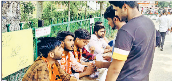
जीद। छात्रों की सहायता के लिए लगाया गया हेल्प डेस्क।