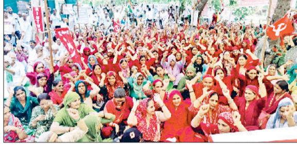
मांगों को लेकर लघु सचिवालय के निकट धरना देते कर्मचारी संगठनों के प्रतिनिधि।