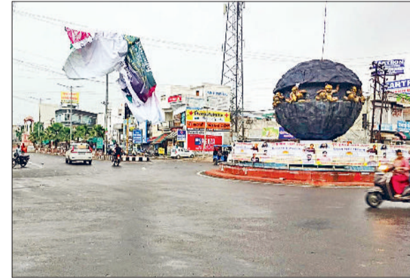
कैथल। कैथल में बरसात के दौरान सड़कों से गुजरते वाहन चालक।

किसानों के खिले चेहरे तापमान में गिरावट होने से मौसम हुआ सुहावना मौसम विभाग ने बताई 24 घंटे बूदाबादी की संभावना