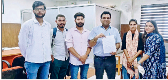
जीद। कंट्रोलर को ज्ञापन सौंपते हुए छात्र।