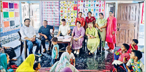
जींद। निरीक्षण के लिए आई टीम।